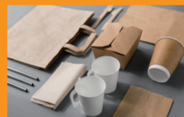
外卖产业链及包装