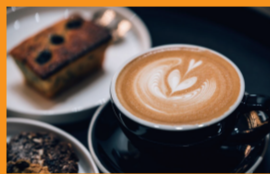
烘焙轻餐、咖啡茶饮