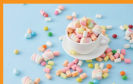
休闲食品甜食巧克力