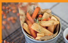
餐饮供应链与新零售