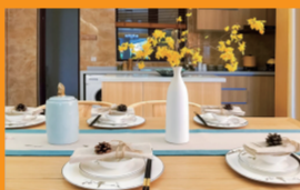
餐饮及智能店装设计